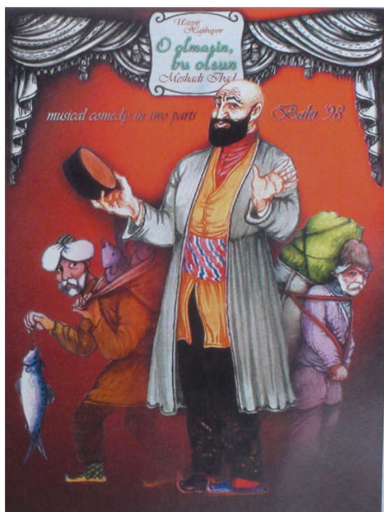
Рисунок 2. Афиша к двухактному спектаклю «Не та, так эта» (или – «Мешади Ибад»), Узеир Гаджибекова. Баку, 1998 г.

Мешади Ибад в характерной танцевальной позе показан на фоне апшеронского поселка и стилизованной театральной декорации, изображающей интерьер дома в виде развернутой ширмы. Второй вариант (рисунок 2) своей лаконичностью, как нам представляется, более соответствует жанру афиши.