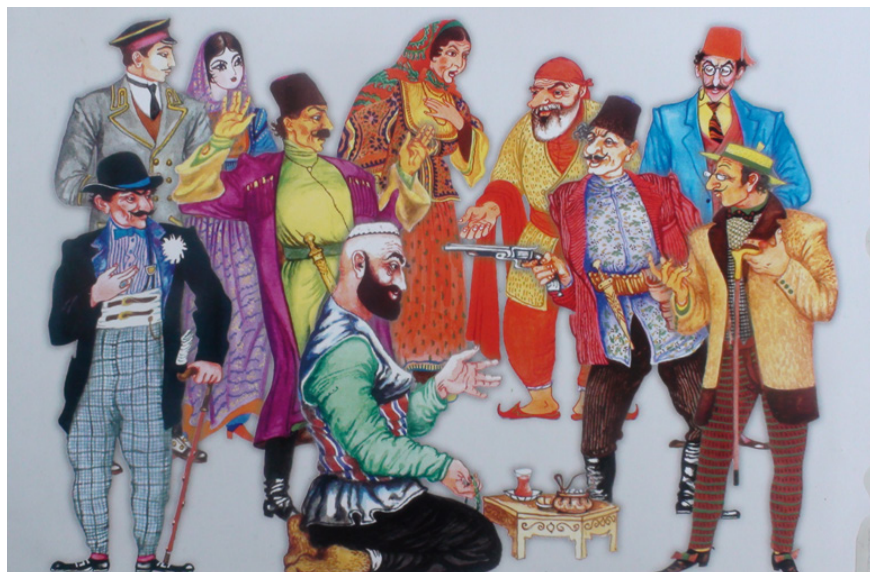
Рисунок 3. Персонажи к спектаклю «Не та, так эта» (или – «Мешади Ибад»), У.Гаджибекова. Режиссер Ж.Селимова. Баку, 1998 г.

образ его родного города, каким он выглядел 100 лет назад, как это в свое время сделал и знаменитый художник-сатирик (рисунок 3).