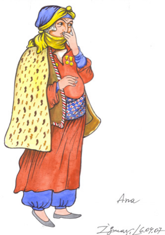
Рисунок 4. Персонаж «Мать семи узниц» к спектаклю «Не та, так эта» (или – «Мешади Ибад»), У.Гаджибекова. Режиссер Ж.Селимова. Баку, 1998 г.

Muzsamedliya Əli Amirlili "Yeddi mohtusa anasi"