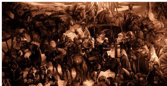
1 сурет – Жақыпбек Ә. «Мәңгілік ел». Кенеп, майлы бояу. 400x200 см. 2016.

түсінуге деген рухтың өзін өзі сипаттауға ұмтылысы болмақ. (1сурет)