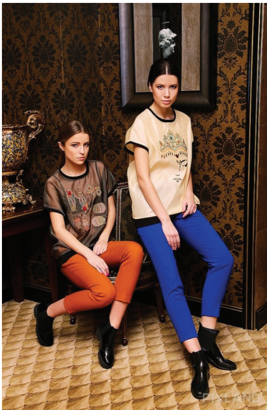
Рисунок 4. Модели бренда Moel Bosh

используя декоративные оборки в меру, создают одежду, образно-ассоциативно выражающую традиции этнического костюма. Так работают Салтанат Баймухамедова, Ерлан Жолдасбек – их платья, достаточно минималистичные по крою и силуэту, но активные и выразительные по цвету, дополнены лаконичными оборками, придающими образу женственность.