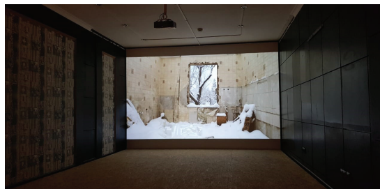
Рисунок 4. Александр Угаев «Белоснежный список» ондоканальное видео, 2мин. 57сек. 2014.

Следующая работа Александра Угая «Белоснежный список» - это ондоканальное видео, в котором мы видим руинированные постсоветские интерьеры, где на них сыплется белоснежный снег на одной из стен тёмного квадратного помещения бывшего ночного клуба, тем самым наслаивая архитектурные формы прошлого, вызывая у зрителей противоречивые колебания интерпритации времени и пространства. (Рисунок 4)