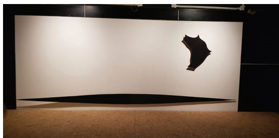
Рисунок 3. Рустам Хальфин «Пулоты», 1995.

Первый, кто встречает нас в залах этого бывшего клуба Рустам Хальфин, его инсталляция «Пулоты», чёрные абстрактные на первый взгляд пятна на больших белых просторах приобретают иной смысл в контексте данного пространства. (Рисунок 3)