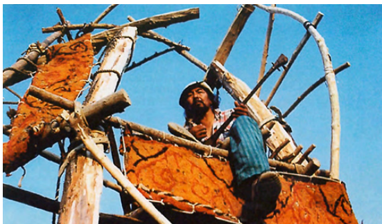
Сурет 1 – PQ'03 жүрегі: «Қызыл Трактор» – Қазақстандық перформансшылар тобы. «Прага Квадриеннале» фестивалінде. 2003 ж.

бойынша алтын белгімен Франц Трестер марапатталды. 1961 жылы – Йозеф Свобода, 1963 жылы Иржи Трнка иемденді. Әлемдік деңгейдегі үш дүркін Биенналеде жеткен жетістіктерінің арқасында Прага бүкіләлемдік европалық сценографтар көрмесін әр төрт жыл сайын өткізу құқығын алды. Ең алғаш халықаралық көрме 1967 жылы «Прага Квадриеннале» атымен танымалдылыққа ие болды. Жыл санап «PQ» деңгейі артып келеді, қазіргі таңда 70 елден астам мемлекеттер белсенді түрде қатысуда. 1975 жылдың басты жаңалығы Квадриенналеге студенттік жұмыстар байқауы қосылды. Байқау жобасы маска, костюм, театрландырылған архитектура салаларынан тұрады.