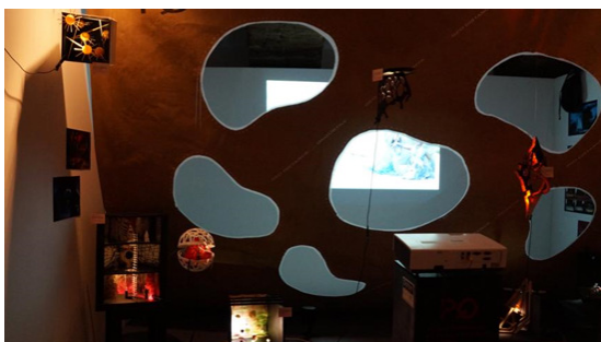
Сурет 5 – «Геодистанция ҮҢГІРТАС – аспан мен жердің тоғысқан нүктесі», студенттер жобасы.