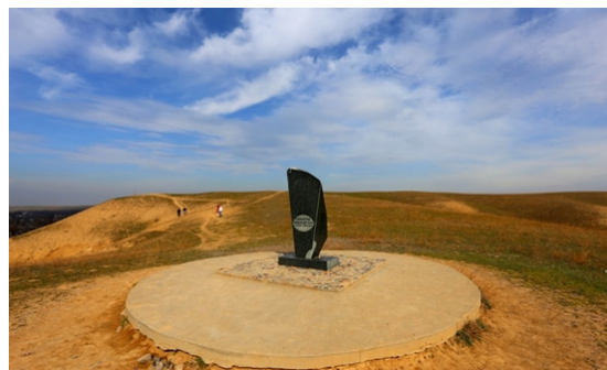
Сурет 5 – Үңгіртас – жер кіндігі.