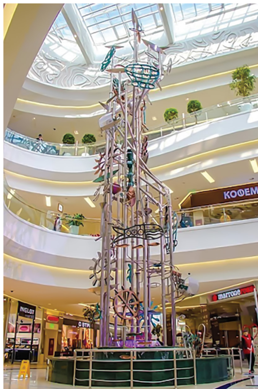
Сурет 3. Ә. Қазарян «Үш элемент» арт-нысаны, «MEGA Park COO», Алматы қ.

глазурьден және бірнеше шақырым арқаннан жасалған.