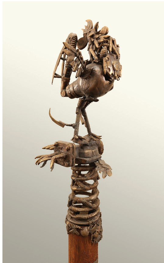
Сурет 6. А. Мергенов «Соғыс». Алюминий.