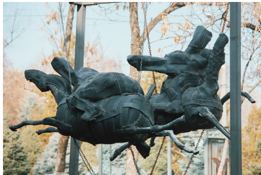
Сурет 4. М. Нарымбетов «Көкпар».

емес, ғасырлық мәдени құндылықтарды қайта өңдеу. Бұл жобанда суретші сонымен қатар бүгінгі күннің экологиялық проблемалары туралы ойландырады.