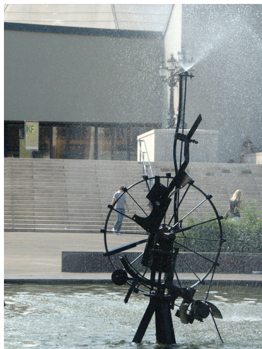
Сурет 1. Ф. Маринетти «Фонтан Тэнгли», Базель қ.

алғашқы манифестінде итальяндық футуристер қозғалысы мәлімдеді. Олар жылдамдықты, қозғалысты, антистатиканы кескіннің жаңа нысаны ретінде мойындады (сурет 1).