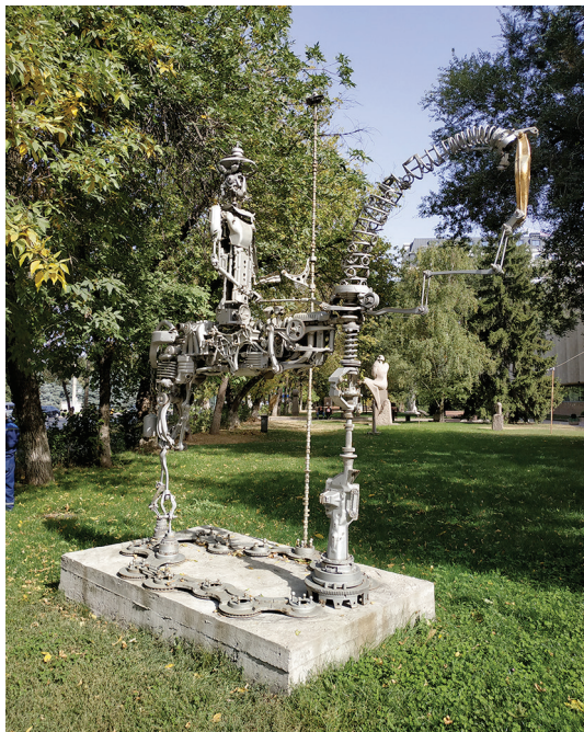
Сурет 7. Р. Ақанаев «Дон Кихот», Алматы қ.

2014 жылғы «Дон Кихот» мүсіні (сурет 7) және 2018 жылғы «Алдар-көсе» (сурет 8) тақырыбындағы стимпанк туындыларында суретші Р. Ақанаев механикалық құрылғыларды қолдана отырып, оларды мүсіндік композицияға «абайлап» енгізеді. Мысалы, «Дон Кихот» шығармасының лейтмотиві — жалғыздықтың трагедиясы, сондықтан зардап шеккен, бірақ жаттанған адамның проблемасын қайтадан көтереді. Бұл жағдайда драмалық интонация дерлік естіледі. Дон Кихоттың бейнесі металл бөліктерден «тоқылып», барлығы бірге стимпанк стилінің эстетикасына