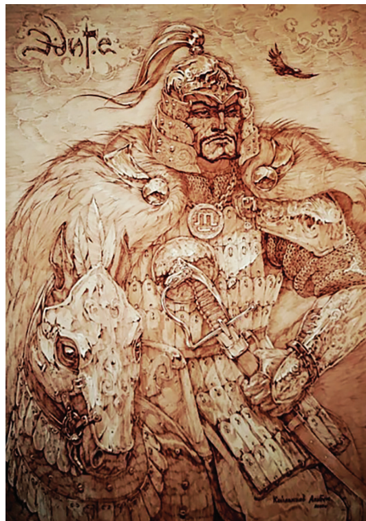
Рис. 6. Алибек Койлакаев. Едиге. Графика

и не найденные масштабные пропорции по соотношению к размерам шлема (а он, как обруч, буквально стискивает голову героя), заставляют на подсознательном уровне воспринимать образ Кюль-Тегина иронично, в качестве анимационного персонажа. Здесь нужно оговориться, что если мы рассмотрим другие графические произведения А. Койлакаева на схожую историко-этнографическую тематику, то убедимся: подобная анимационная «фэнтезийность» характерна всему творчеству самобытного художника (см. рис. 6 ). Тогда вполне ожидаемо, что и в этот раз, обращаясь к образу Кюль-Тегина, художник не изменил своим изобразительно-эстетическим идеалам.