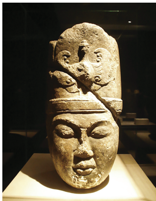
Рис. 1. Голова от статуи Кюль-Тегина, найденная в результате археологических изысканий на месте погребального комплекса в честь полководца

В большинстве древних исторических периодов Казахстана присутствовали легендарные представители из числа воинов, полководцев и каганов, деяния которых дошли до наших времен благодаря трудам различных ученых, путешественников, а также архивным и археологическим источникам. В очень редких случаях, благодаря археологическим изысканиям, до современных потомков древних народов Великой Степи дошли даже реликтовые изображения портретов и других внешних данных легендарных исторических личностей. Одним из таких археологических экспонатов является так называемая «голова Кюль-Тегина», древнетюркского полководца, посвятившего свою жизнь делу объединения племен в единое государство — Второй Восточно-Тюркский каганат (см. рис. 1 ).