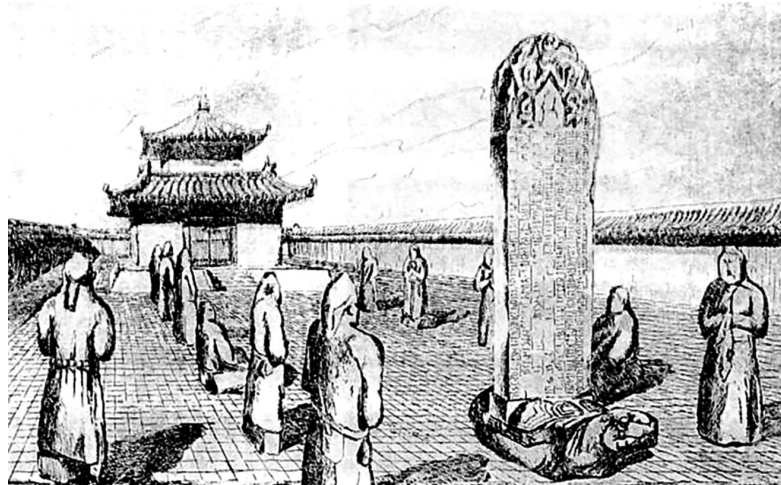
Рис. 2. Реконструкция погребального комплекса в честь Кюль-Тегина

к орхоно-енисейской культуре. Тексты посвящены описанию жизнедеятельности Кюль-Тегина и его заслугам в деле укрепления государственности Тюркского каганата. Ученые считают, что рунические надписи воспроизводят поминальную речь в честь Кюль-Тегина, произнесенную его