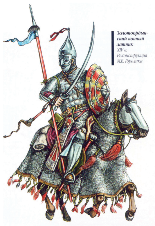
Золотоордынский конный латник XIV в. Реконструкция М.В. Горелика

декорирована орнаментом и имеет прорези в виде человеческих глаз, а в ее решении использованы стилизованные портретные элементы степных балбалов (см. рис. 4 ). Об использовании такого вида забрала — с имитацией человеческого лица — в военно-прикладной культуре древних и средневековых кочевых народов Евразии упоминается в многочисленных реконструкциях и научных работах российского и советского востоковеда, исследователя истории оружия М. В. Горелика (1946–2015). Также об этом виде вооружения упоминается в книге «Этнография традиционного вооружения казахов» казахстанского ученого, художника, этнографа-оружиеведа К. С. Ахметжанова.