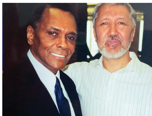
Рис. 2. Жанат Байдаралин и Артур Митчелл. 2004.

Руководил этой грандиозной компанией один из самых выдающихся деятелей черного искусства Arthur Mitchell — первый на планете черный танцор классического балета (см. рис. 2). Он был солистом у Баланчина в New York City Ballet в течение 20 лет. Затем он создал свою