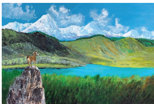
Рис. 11. Ж. Байдаралин. Без названия. Холст, акрил, смешанная техника, 95x68. 2020