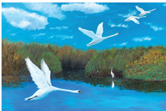
Рис. 8. Ж. Байдаралин. Без названия. Холст, акрил, смешанная техника, 95x68. 2020

и наверняка он мог бы многое сделать для нашей страны. Но даже сам факт его существования и возможности услышать его уже дает большой стимул для развития. Он как непотопляемый корабль со стойким капитаном на борту, плывущий к цели вопреки всем встречным ветрам. Он не сдавался никогда. Известный казахский хореограф любит свою родную страну и болеет за нее всем сердцем, но и за жизнь всего мира тоже. Это чувствуется в каждом его эмоциональном предложении, наполненном энергией, счастьем и желанием творить.