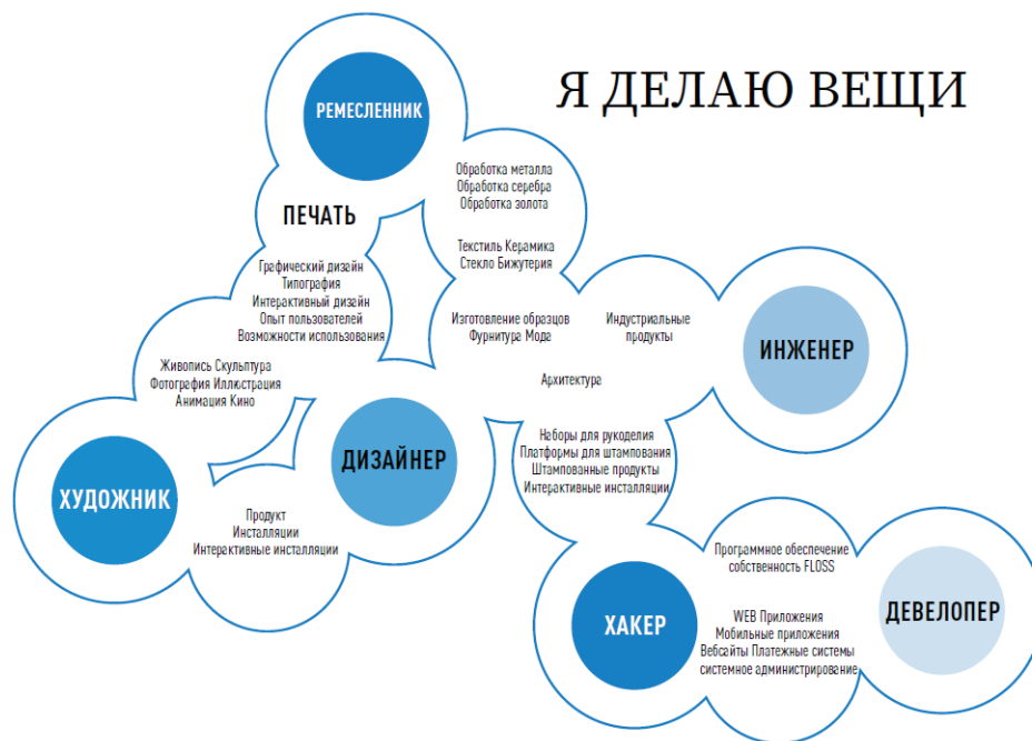
Рис. 3. Шаблон «Карта индустрий». Учебно-методическое пособие «Креативное предпринимательство». Ж. Джумадилова и Ю. Сорокина. КазНАИ имени Т. К. Жургенова, 2022.

к существованию и достойной жизни. Давно настало время исправить образовавшийся перекоп в арт-образовании. В связи с чем нам видится следующая дорожная карта дальнейшего