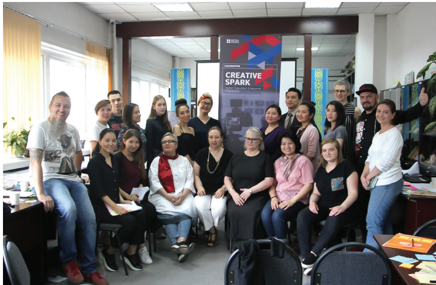
Рис. 1. Участники мастер-класса по креативному предпринимательству. Библиотека КазНАИ имени Т. К. Жургенова, 2018.

«Диагностика основных компетенций, знаний и навыков креативных предпринимателей в Казахстане». Исследование составило своего рода портрет креативного предпринимателя Казахстана, в процентном соотношении состоящий из следующих старт: «Из числа опрошенных креативных предпринимателей наибольшее количество респондентов представляет сектор дизайна, включая дизайн одежды — 33,9 %, в секторе музыки и организации музыкальных фестивалей заняты 14,5 %, кино- и видеопроизводством занимаются 17,7 %. Одновременно работают в нескольких секторах (от 2 и больше направлений) или ведут межсекторальные проекты 25,8 % респондентов <...> Важно отметить, что большинство опрошенных предпринимателей имеют высшее