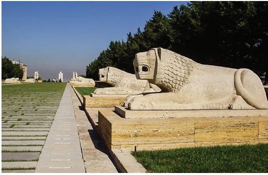
Рис. 8. Аныткабир. Анкара. 1944–1953. Архитекторы Э. Онат, А. О. Арда. «Львиная аллея». Фото Е. Кононенко, 2009.

Обсуждение многих значимых конкурсных проектов 1950–1960-х гг. сводилось к дискуссии на тему «Интернационализм или регионализм?», и в тех случаях, когда право выбора оставалось за правительственными инстанциями, предпочтение отдавалось именно второму варианту (Sey and Tapan 73). Турецкие теоретики искусства сформулировали идею о том, что «тренд современности» в искусстве может приобретать выраженную национальную окраску, а турецкие архитекторы в целом ряде построек смогли продемонстрировать, как именно эта идея может быть удачно реализована на практике.