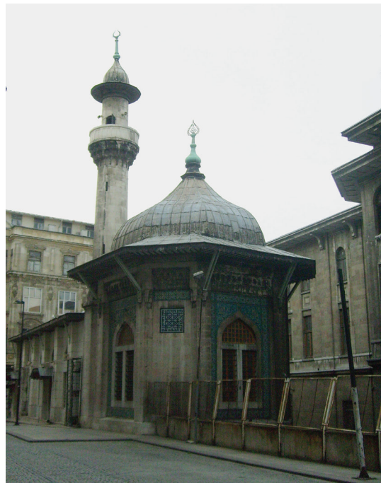
Рис. 4. Мечеть Хобьяр. Стамбул. 1909. Архитектор М. Ведат Тек. Фото Е. Кононенко, 2016.

послужила и задачам визуального воплощения правопреемственности Турецкой республики по отношению к упраздненному в 1922 г. султанату и легитимизации нового строя в глазах приверженцев старого режима. Мастера этого направления в рамках национального модерна использовали сложившийся иконографический репертуар для создания образа, соответствовавшего новой национально-государственной доктрине (Bozdoğan, 36–54; Кононенко «Турецкая мечеть: между неоклассикой и не-классикой» 156) (см. рис. 5).