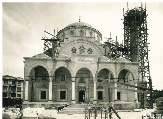
Рис. 6. Мечеть Шишли. Стамбул. 1945–1949. Архитектор В. Эгели. Фото конца 1940-х годов.

увлечение археологией, «хеттская тема» в оформлении Аныткабира (мавзолея Ататюрка), насыщение построек античными элементами, имитация византийской техники, сельджукские мотивы в декоре ряда провинциальных мечетей. Архитектура «Второго национального движения» уделяла особое внимание адаптации трендов мирового зодчества (особенно в жилищном строительстве) к локальным условиям климата, освещения, рельефа местности, традиционным строительным материалам (Кононенко «Турецкая мечеть: между неоклассикой и не-классикой» 157–161; Özaslan , 344–346) (см. рис. 6, 7, 8).