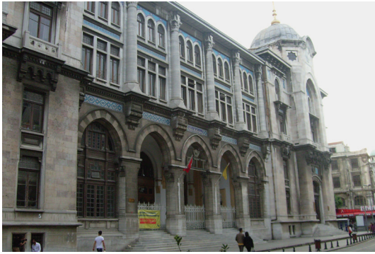
Рис. 3. Почтамт. Стамбул. 1903–1909. Архитектор М. Ведат Тек.

Турецкие зодчие 1910-х гг. создавали обобщенный архитектурный образ, отсылавший уже не к конкретным историческим памятникам (как это было в архитектуре «османского Ренессанса»), а скорее, к желаемому представлению о соответствии национальной культуре. Они уже не ограничивались репертуаром неоосманского стиля, предложенным в «Основах османской архитектуры», и обращались к различным пластам средневекового анатолийского архитектурного наследия, применяя анахроничные конструкции, материалы, элементы декора, вплоть до столь ценимых Гёкальпом продуктов традиционных ремесел и промыслов (стамбульские частные особняки, гробницы, мечети Хобьяр, Бебек, Кюльюглу в Бостанджи, Амине Хатун в Бакыркёе). Подобная эксплуатация «цитат» вполне соответствовала методам модерна, однако главными задачами снова стали поиски, во-первых, оптимальной визуализации критериев самоидентификации (теперь уже в рамках не общегосударственной, а национальной принадлежности) и, во-вторых, именно локального, национального варианта привнесенного интернационального стиля (аналогии ар-нуво, югендштиль, сецессион, либерти и т. д.) (см. рис. 4).