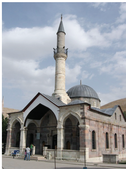
Рис. 2. Мечеть Азизие. Пинарбаши. 1903–1913.

для «османского Ренессанса» — той «классикой», которую следовало «возродить», — оказались сравнительно небольшие культовые сооружения позднесельджукского и раннеосманского периодов, когда (в романтизированных представлениях «новых османов») культура мусульман Анатолии еще сохраняла «национальную чистоту» и не подвергалась инородным (прежде всего византийскому, а затем итальянскому и французскому) влияниям (см. рис. 2).