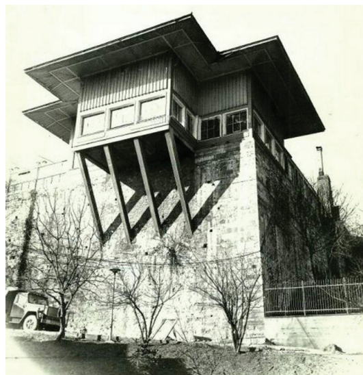
Рис. 7. Кофейня «Ташлик». Стамбул. 1948. Архитектор С. Эльдем. Фото 1950-х годов.