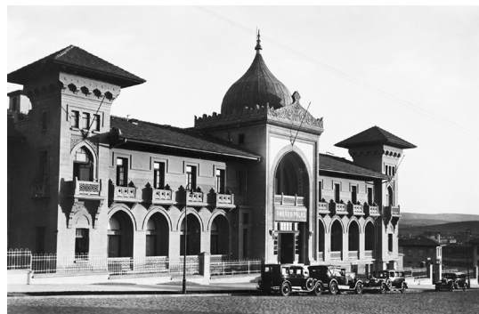
Рис. 5. Анкара Палас. Анкара. 1924–1928. Архитекторы А. Кемалеттин, М. Ведат Тек. Фото 1930-х годов.